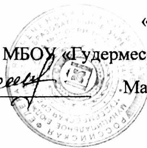
График проведения семинаров стажировочных площадок на базе МБОУ «Гудермесская СШ №7» на сентябрь- октябрь 2015г.